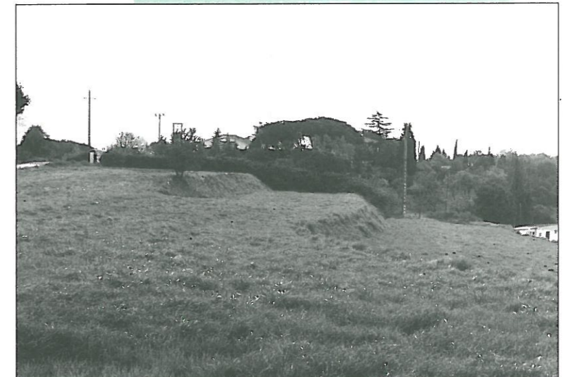
Terrenys destinats a la construcció de l'Institut d'Educació Secundària de Sant Pere de Vilamajor.