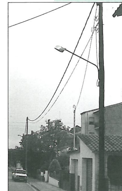
Concedida la subvenció del Pla de Cooperació i Assistència Local 1996-1997 de la Diputació de Barcelona, per al projecte de canvi de l'enllumenat públic del nucli urbà, en la seva tercera fase.