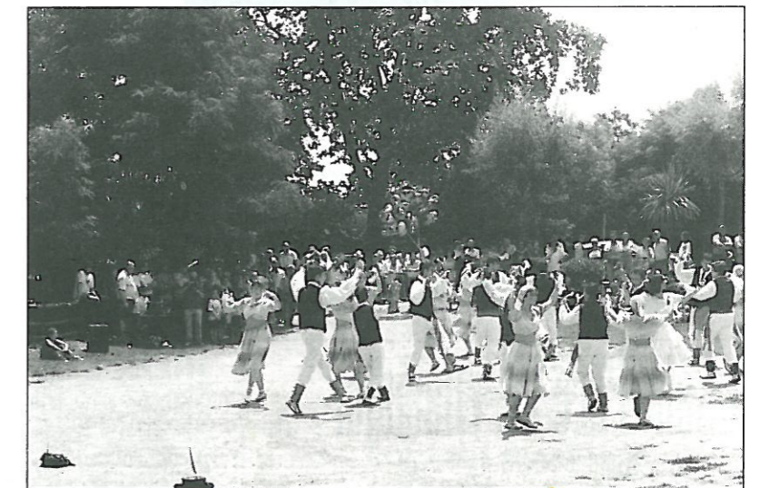
Festa Major '96. Ball de Gitanes