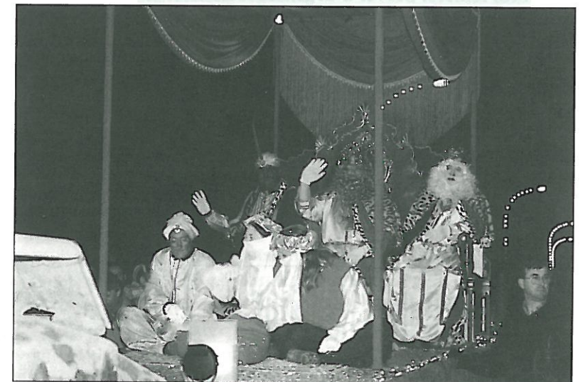
Arribada de Els Reis de l'Orient a Sant Pere de Vilamajor.