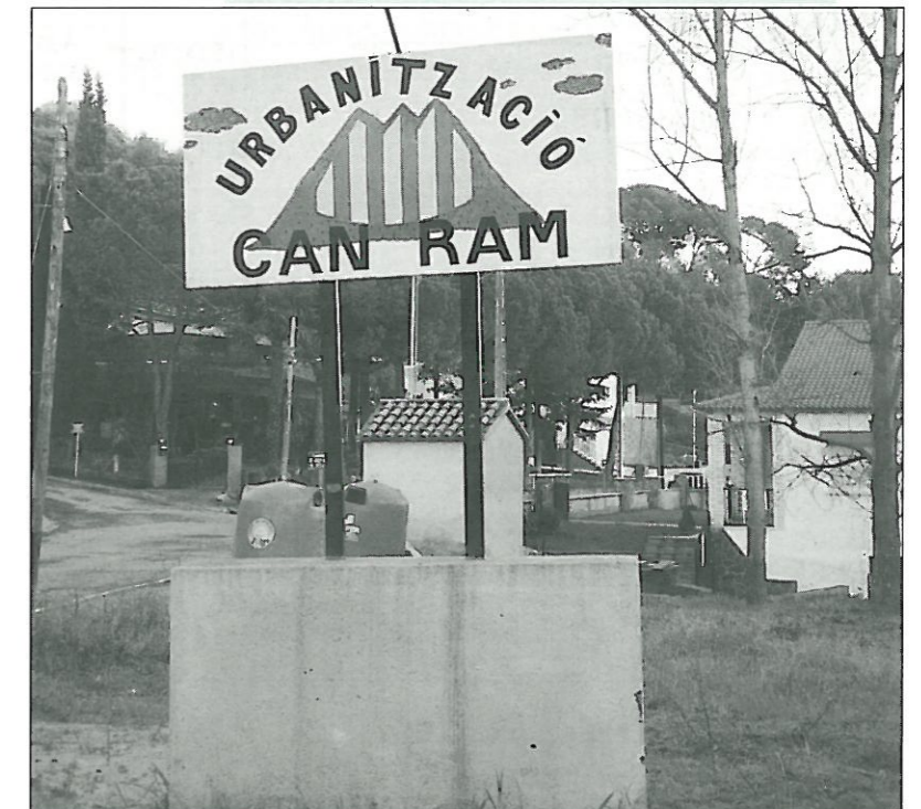
El Departament de Governació atorga a Sant pere de Vilamajor la propietat de 54 parcel·les de la urbanització Can Ram.