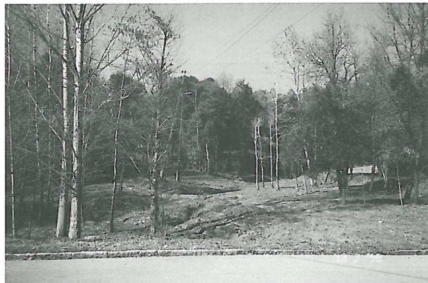
Parcel·la neta a Can Derrocada

Aquesta ordenança es regula pel Reglament d'Activitats Molestes, Insalubres, Nocives i Perilloses". - Ordenança de nova creació regula el preu públic per ocupació de terrenys d'ús públic.